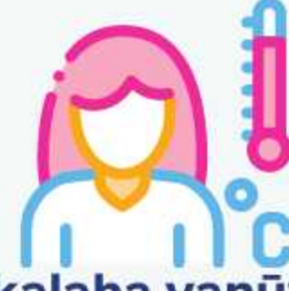
kalaha vanüyöre örheü -heü hek tö 04 kantra