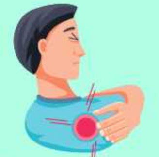
chanök küö alahā