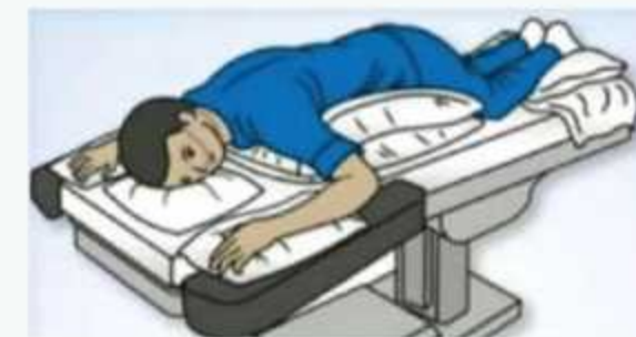
fatngö kuö re, ngaich kalék öm uhòm hót unhömöre hök ngam unhomöre meh nö vayö inlaha