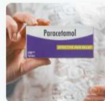
1.òk lane - en to paracetamol öm 06 hang kantra kuö hek nup ok amehe inre)