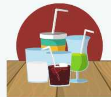
òk mak , soup, mak limong , ok ta-okö