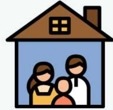
höng ngöh i pati