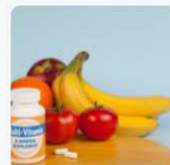
nup multivatamins and mineral