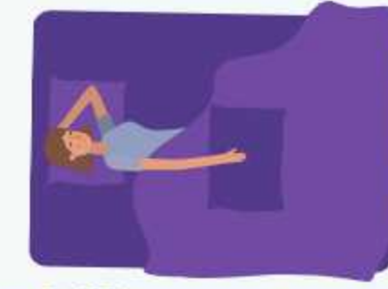
haköhngen rengaich heuheurët