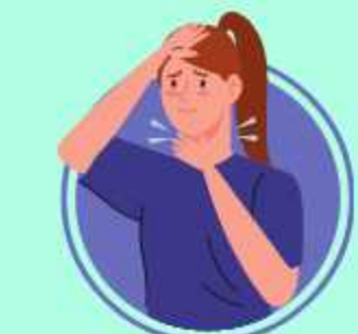
chanök ël kilöp