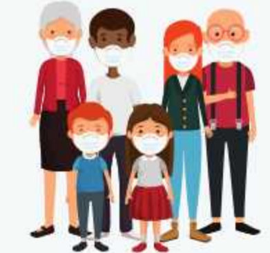
ròkhöre öi hoin massuvö küö