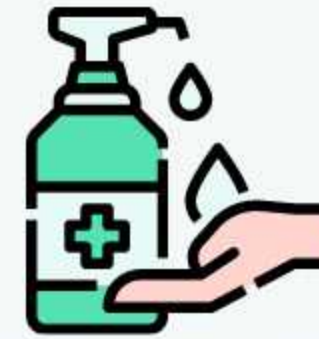
söich kuntire tö sanitizer