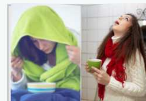
kahulöre to törach mak/ kichav elvangre inre