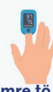
kalāh mahāmre tö ròken öp unhömöre nö in e (örheü heü hek tö 04 kantra