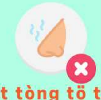
öt tòng tö tòngö